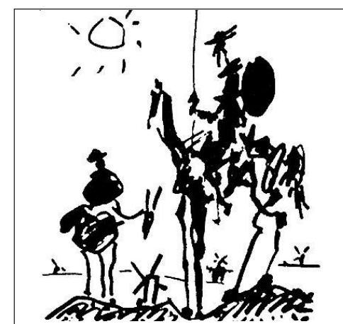
Segno d'autore Un disegno di Picasso

Che ne so io? Queste sono domande da fare al dottor Freud. Io sono solo un terrestre del 2030, mi chiamo Sancio Panza e adesso devo lasciarvi per andare a soccorrere il mio padrone, Don Chisciotte della Mancia, che è appena stato disarcionato da una pala eolica. L'aveva scambiata per un Ufo Robot.