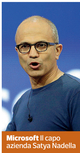
Microsoft Il capo azienda Satya Nadella

La soluzione di Microsoft al problema è talmente semplice da sembrare scontata: Windows Phone 10 è una versione scalabile dello stesso Windows 10 da scrivania. L'aggiornamento non limita i due sistemi alla sola compatibilità dei documenti, ma permette a entrambi di eseguire proprio gli stessi programmi: le app