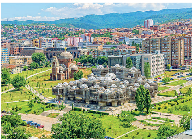
Pristina Uno degli ultimi post di Spottedbylocals.com è dedicato alla città del Kosovo

Questa la prima chiave del successo secondo la classifica di due siti specializzati: Medium e Fast Company. Al vertice della classifica, Airbnb continua a sviluppare una filosofia che oltre al semplice pernottamento mette a disposizione dei clienti un ventaglio di esperienze, con guide ad hoc e suggerimenti specifici per ogni località: ex start up undici anni fa, l'azienda di San Francisco resta un modello di sharing economy ed è va-